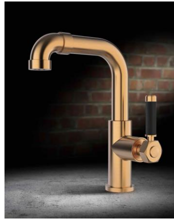
Vintage or brossé/ noir mitigeur poignée latérale

Corinne Lienhart, Relations presse corinne.lienhart.rp@free.fr partenaire de tac comunic@ziona milano|genova tel +39 02 48517618 | 0185 351616 press@taconline.it | www.taconline.it