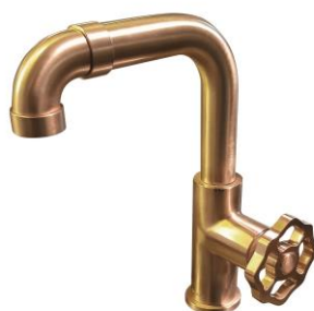
Vintage or brossé poignée ronde