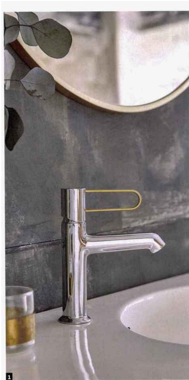
1. Odeon Rive Gauche Mitigeur monotrou, avec poignée filaire, ici dans une version bicolore (Jacob Delafon). Disponible dans de nombreuses finitions combinables: noir mat et chrome pour le corps, et blanc, noir, chrome et doré pour les leviers.