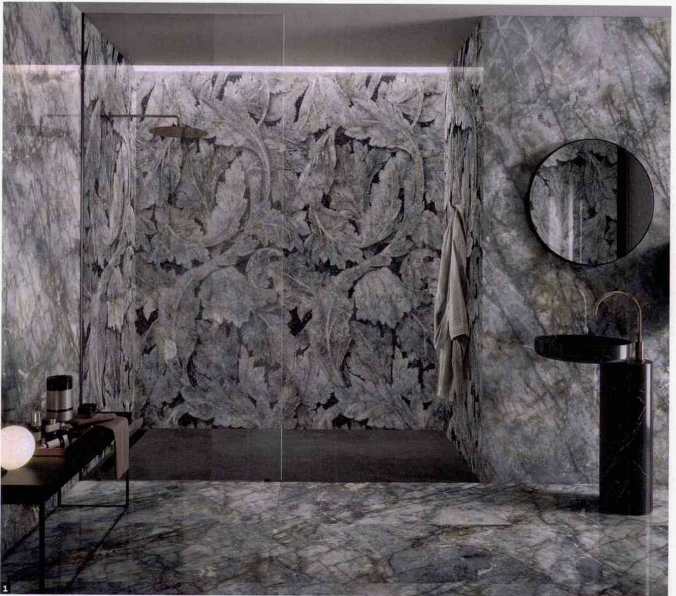
1. Tele Di Marmo Revolution Revêtement sol et murs en grès cérame de grand format imitant le marbre et des mosaïques de marbre, dans divers coloris naturels ou plus sombres, avec une finition brillante ou naturelle (Emil Ceramica). Photo: coloris Blue Ande (gris bleuté), avec au sol des carreaux rectifiés finition brillante de 60 x 120 cm et au mur des surfaces de 120 x 278 cm rectifiés, finition brillante avec motif mosaïque d'acanthes. À partir de 102 euros TTC le mètre carré. Où trouver Tele Di Marmo : Showroom David B - www.david-b.fr