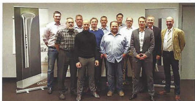
Die Handelsvertreter der Graff GmbH für Deutschland

Graff hat sich für Investitionen in Deutschland entschieden, die hinsichtlich Kundenservice, Technik und Kommunikation beträchtliche Verbesserungen bringen sollen: Die Geschäftstätigkeiten des Unternehmens werden seit Januar 2016 zielgerichtet von der neu gegründeten Graff GmbH in Stuttgart gelenkt, die den Geschäftspartnern bessere Serviceleistungen und Rahmenbedingungen für eine erfolgreiche Vermarktung von Graff-Armaturen und Accessoires bieten kann. In Zusammenarbeit mit einem Dienstleister wird das Serviceangebot in Deutschland deutlich ausgeweitet. Mit der Einrichtung einer deutschen Hotline (0711-50622936) bietet das Unternehmen künftig noch besseren Kundensupport. Zudem steht ein neuer technischer Service für Reklamationen und Reparaturen bereit: Unter der Telefonnummer 07127-9296258 sind Experten und Techniker erreichbar, die auf Abruf deutschlandweite Reklamationsaufträge absolvieren. Dabei steht die Graff GmbH selbst in regelmäßigem Kontakt mit den betreffenden Unternehmen und Endkunden. Graff möchte seinen deutschen Kunden mit dieser Neuorganisation eine noch intensivere Partnerschaft bieten. Zur Qualität der Produkte tritt damit eine deutliche Verbesserung im Dienstleistungsbereich. Weitere Informationen zu Graff finden Sie unter: www.graff-faucets.com .