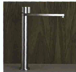
SIGNORINI COLLEZIONE ZIRMA design Signorini Research & Development

Collezione di rubinetti dall'estrema pulizia di forme, che coniuga progetto, prodotto, ambiente, design e qualità. Realizzata in acciaio inox AISI 304 spazzolato, la serie è declinata in elementi che spaziano dai miscelatori monocomando ai miscelatori termostatici ai gruppi bordo-vasca con doccetta estraibile ai maxi soffioni doccia a parete con sistema RGB. La finitura spazzolata dona maggiore rigore ed eleganza a tratti già essenziali.