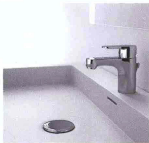
MAMOLI H2VIP GAMMA PROJECT design Studio Batoni

Serie di rubinetteria dalle linee pure e semplici. Offre la possibilità di limitare la portata d'acqua oltre il 50% della massima (12 l/min), anche grazie all'impiego di aeratori ad hoc. Proposta in bianco, nero e cromo, la linea è realizzata esclusivamente con materiali compatibili al 100% con acqua potabile - certificati ACS - ed è composta da ottone di composizione chimica nota, contenente un bassissimo tenore di nichel e una ridotta percentuale di piombo.