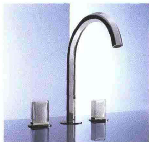
FRATELLI FANTINI VENEZIA design Matteo Thun & Antonio Rodriguez

Collezione di rubinetteria lavabo ispirata a canoni di eleganza e qualità del progetto, espressa nella massima cura per il dettaglio. Nella linea, l'alta artigianalità del vetro soffiato di Murano è abbinata a preziosi dettagli in oro e argento declinati in esatto rigore geometrico, dove il metallo è reinterpretato con finiture shining per dare origine a maniglie che diventano un dettaglio prezioso e distintivo della collezione. Disponibili in argento, cromo, nichel PVD, oro plus.