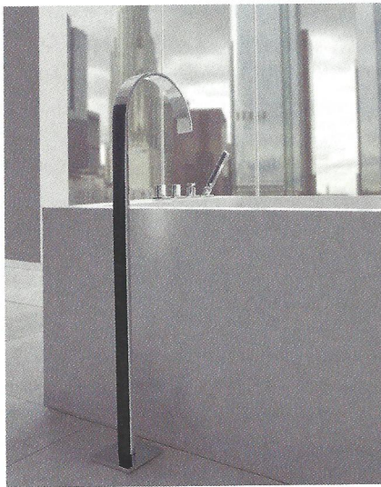
Ein architektonisches Element: Sade streckt sich einem schlanken Schwanenhals gleich über den Wannenrand.

Armaturen von Graff gliedern sich laut Anbieter harmonisch in das Badambiente ein, ohne zu dominieren – so auch die Armatur Sade: Schlank und elegant präsentiert sie sich als modernes, architektonisches Element. So wird das kubische Design mit einem Schwanenhals-Wasserhahn kombiniert und die dezent gebogenen Griffe nehmen dieses Spiel auf. Gleichzeitig soll der gebogene, flache Wasserfluss an einen Wasserfall erinnern und eine ruhige Atmosphäre verleihen. Der Flachstrahlregler reichert das Wasser mit Luft an und verhindert so einen Spritzwasser-Effekt. Zudem erlaubt die Armatur Sade verschiedenen Gestaltungsmöglichkeiten, da sie in zehn unterschiedlichen Varianten erhältlich ist: als Einhebelmischbatterie, als Zweigriffarmatur, für die Wandmontage oder als Standarmatur. Passend dazu gibt es eine freistehende Badewannenarmatur mit Handbrause. Das Oberflächenfinish namens Steelnox macht die Armaturen laut Graff widerstandsfähig, resistent gegen Fingerabdrücke und somit für